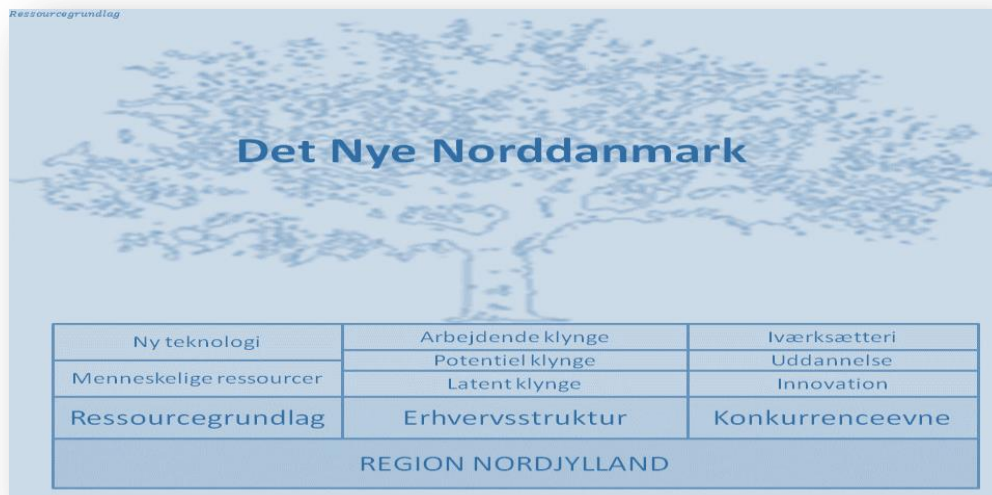
Figur D.1 Beskrivelsesmodel for Regional Vækst

På baggrund af tre blanketligninger for ressourcegrundlag, erhvervsstruktur og regional konkurrenceevne er det nu muligt at identificere de otte søjler, som det nye Nordjylland skal bygges på, hvilket er illustreret i nedennævnte figur D1.